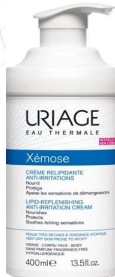
KREM DO SKÓRY BARDZO SUCHEJ