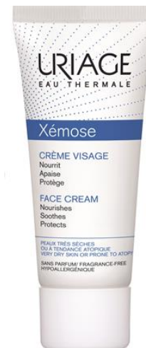
KREM DO TWARZY